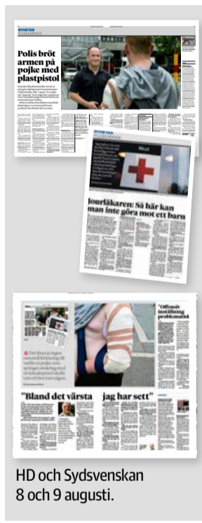
HD och Sydsvenskan 8 och 9 augusti.