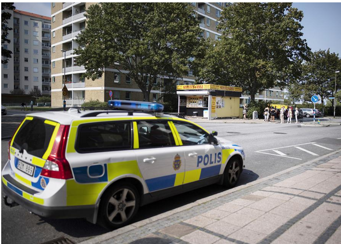
Polisen har ökat sin närvaro i stadsdelen efter dådet.