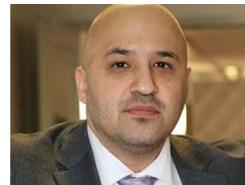
Ardavan Khoshnood.

Antalet skjutningar och dödsskjutningar i Malmö har minskat kraftigt under 2019. Efter att ha läst vittnesmål från brottsplatsen där kvinnan blev mördad i måndags är kriminologen Ardavan Khoshnood orolig för att trenden kan vända. – Är det så att de sköt kvinnan för att de inte kom åt hennes man så kan de ha öppnat Pandoras ask, säger han.