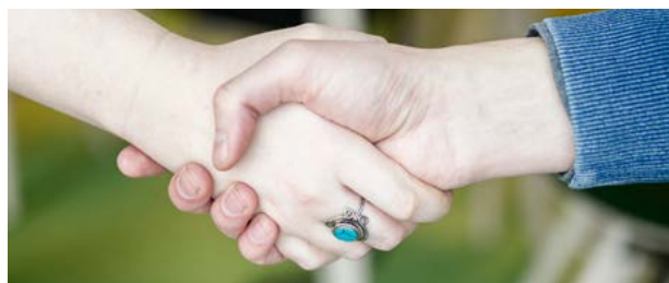
Krav i Trelleborg.