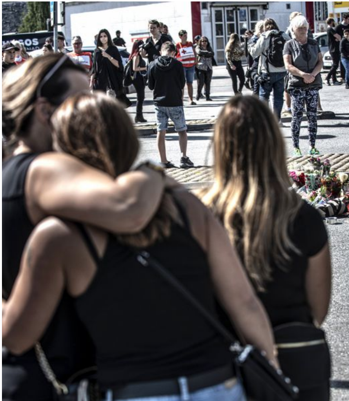
Sörjande i alla olika åldrar har samlats på platsen där en tolvårig flicka sköts till döds natten till söndag.

– Vid dessa tragiska händelser brukar polisen gå "all in". Detta kommer resultera i att individer grips. Emellertid tror jag att chanserna är rätt låga för att någon ska fällas i en domstol.