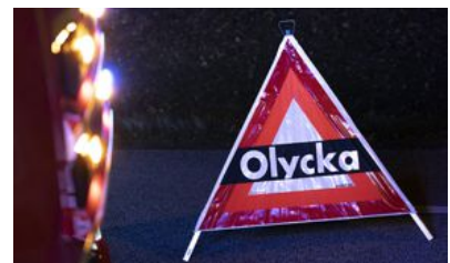
Tre barn skadades i en olycka med en fyrhjulning i söndags. Foto: Johan Nilsson/TT (Arkivbild)

Enligt Universitetssjukhuset i Örebro är mannens skador allvarliga men inte livshotande. TT