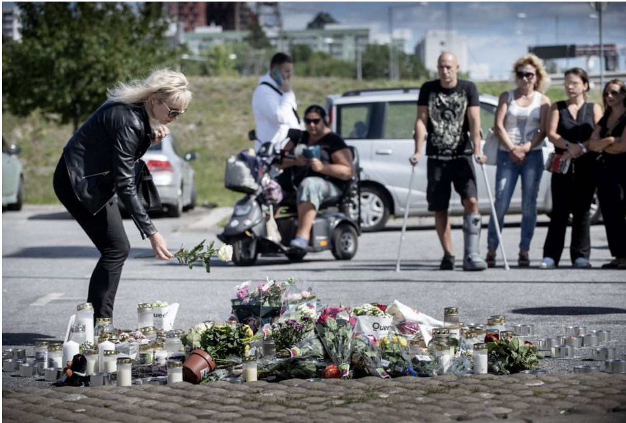
Det hinner aldrig bli tomt på folk runt minnesplatsen vid bensinmacken i Botkyrka. Föräldrar, barn, poliser, nattvandrare, socialtjänst och Röda korset samlas vid de brinnande ljusen och de många rosorna.