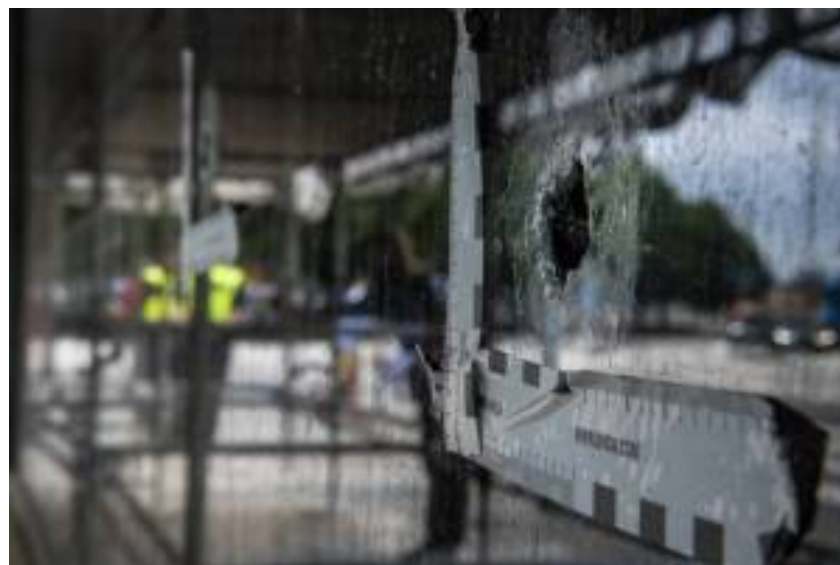
De banderelaterede skyderier har blandt andet fundet sted i Malmø.

De sidste fire år har der været omkring 1.200 https://polisen.se/om-polisen/polisens-arbete/sprangningar-och-skjutningar/ skudepisoder og omkring 150 skuddrab.