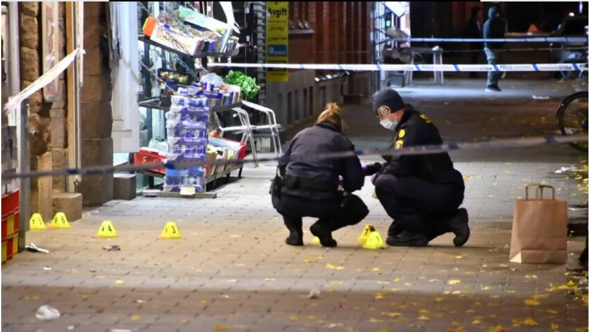
Politiet i Malmø på overarbejde efter et skyderi i byen sidste år.

Selvom svenskerne er vores tætte - og ofte meget sammenlignelige naboer - så skiller deres kriminalitetsstatistikker sig på mange måder væsentligt ud fra dem, vi ser her i Danmark.