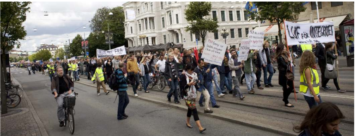
Nätverket Svart måndag arrangerar demonstration mot den nya FRA-lagen i Göteborg 2008. Demonstrationståget går längs Avenyn från Gustav Adolfs torg till Götaplatsen.

– En stor risk är åsiktsregistrering. Vad händer om vi efter kommande val får förhålla oss till ett M- och SD-styre?