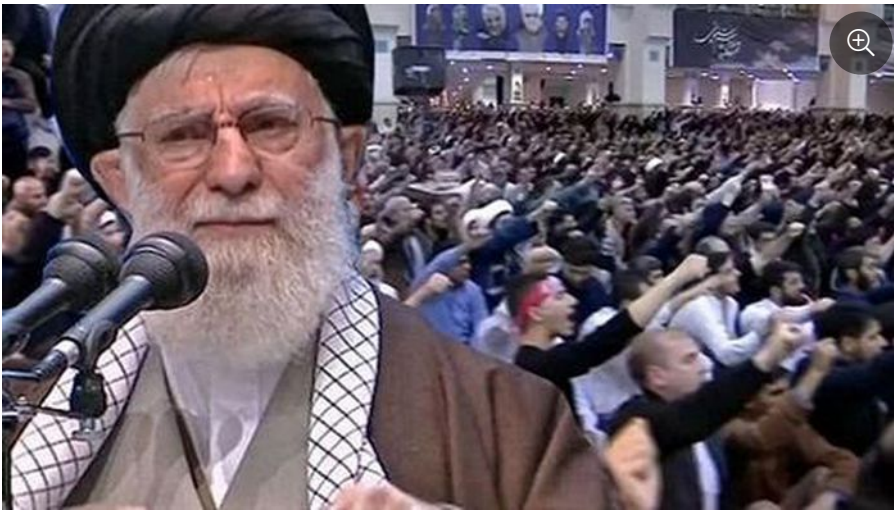
Lãnh tụ Tối cao của Cộng hòa Hồi giáo Iran Ali Khamenei

Hội đồng bao gồm 88 giáo sĩ được nhân dân bầu ra với nhiệm kỳ 8 năm, mặc dù tất cả các ứng cử viên phải được Hội đồng Giám hộ (Guardian Council, GC) phê chuẩn trước. Cuộc bầu cử Quốc hội gần đây nhất được tổ chức là vào năm 2016. Người đứng đầu hiện tại của cả Hội đồng Cố vấn về Lãnh tụ và Hội đồng Giám hộ là Ahmad Jannati.